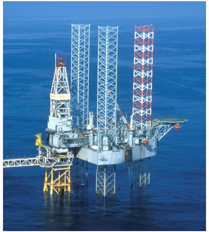
試掘で使用した海洋掘削装置・Transocean Galaxy II drill rig