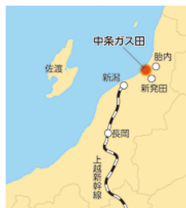
中条ガス田位置図